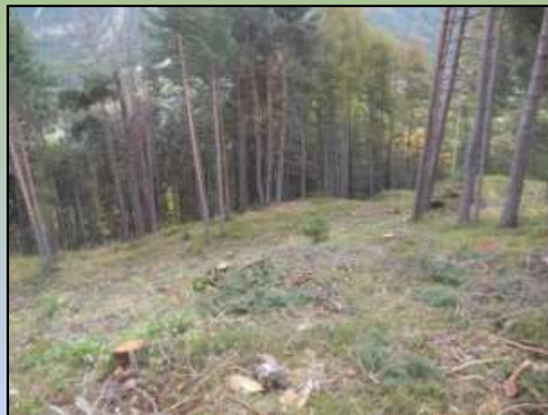
Comune di Valdidentro – Loc. “Le Motte”