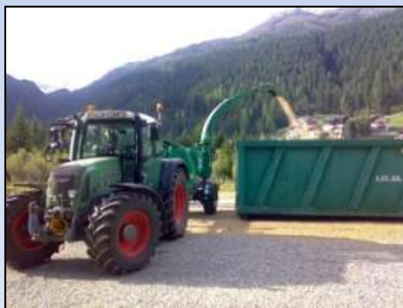
Operazione di cippatura