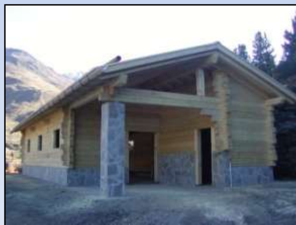
Comune di Valfurva – Alpeggio Salettina