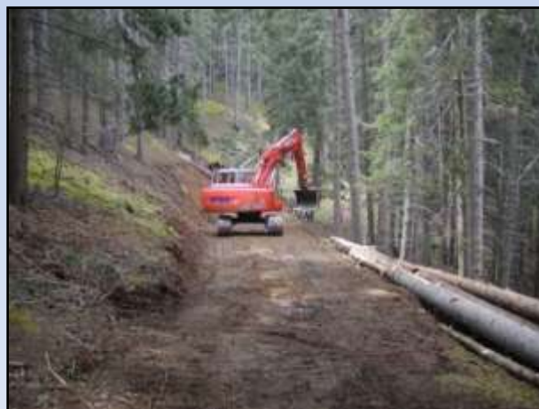
Comune di Valfurva – Località Marta

Sviluppo e adeguamento della viabilità forestale