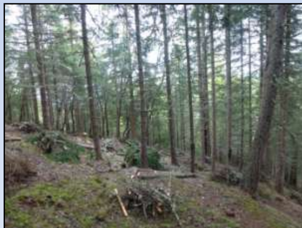
Comune di Valfurva – Particella 6