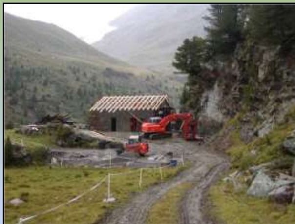
Comune di Valfurva – Rifacimento stabile alpeggi in località “Salettina”