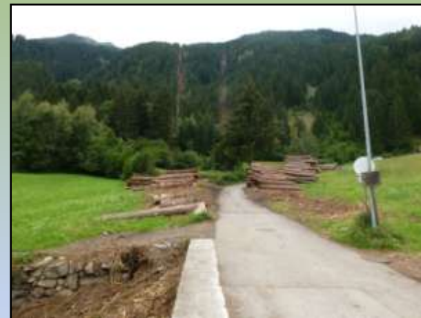
Comune di Valdisotto – Particella 45