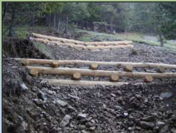
Comune di Sondalo – Bosco Tenso di Frontale – Realizzazione di una palificata doppia in legno