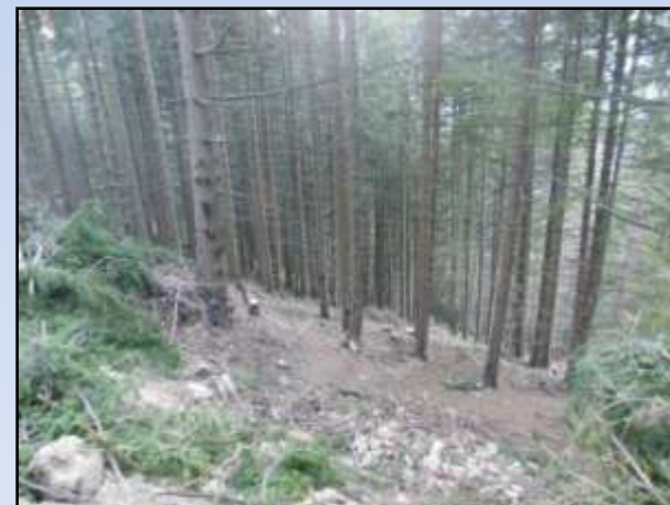
Comune di Valdisotto – Particella 49