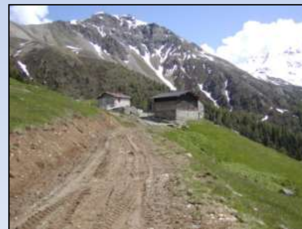
Comune di Valdidentro – Località “Alpe Prei” – Adeguamento della viabilità di accesso