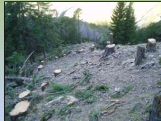
Comune di Sondalo – Particella 5