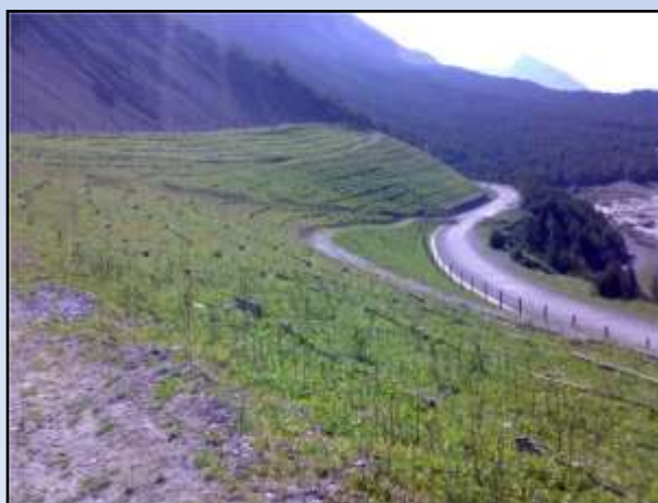
Comune di Valdidentro – Località Cava Frana – Lavori di ripristino ambientale