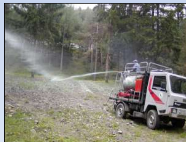
Comune di Valdidentro – Inerbimento mediante idrosemina