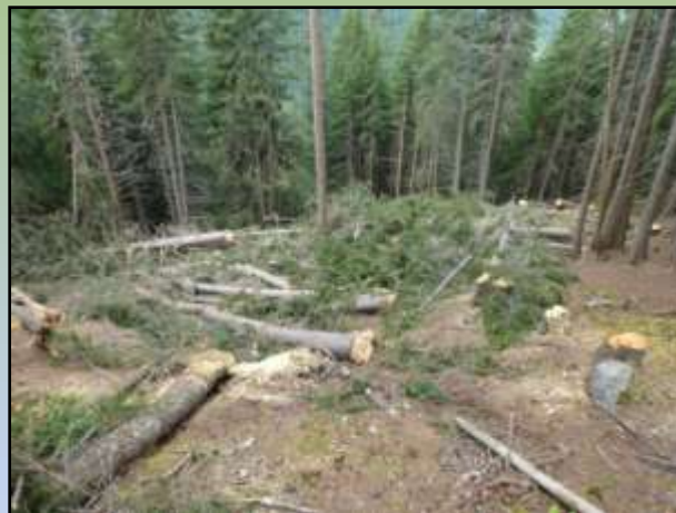
Comune di Valfurva – Particella 15