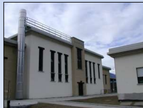
Centrale di teleriscaldamento di Tirano