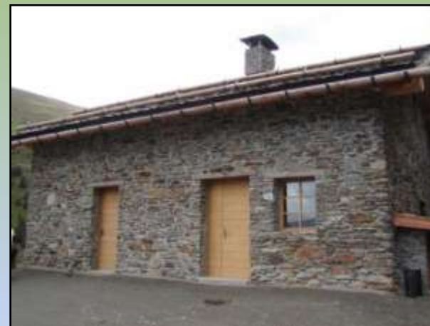
Comune di Valfurva – Alpeggio Salettina