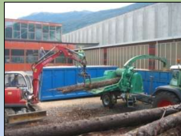
Cippatura – Attività dimostrative