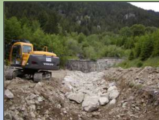
Comune di Valdisotto – Torrente Vallaccia – Realizzazione di selciato in alveo