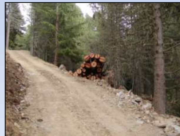
Comune di Valfurva – Località Pedronel

Sviluppo e adeguamento della viabilità forestale